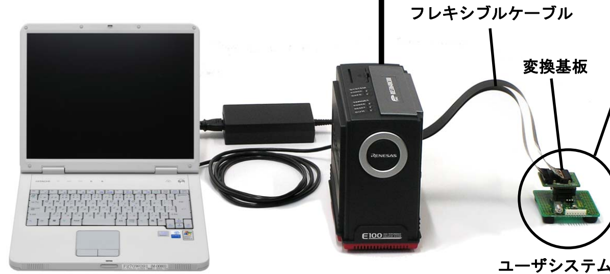
フレキシブルケーブル

※必ず電源を切った状態でユーザシステムを接続してください。 ※ユーザシステムには別途電源を供給してください。(ユーザシステム用電源は別途ご用意ください) ※ユーザシステムでは、MCU を動作させるための端子処理が必要です。 (例: RESET 端子、モード端子、クロック回路など) ※E100 はユーザシステムを接続しない状態でも動作可能です。この場合、E100 のフレキシブルケーブルには変換基板を接続しないでください。接続した状態で起動した場合、MCU がリセットされた状態となります。