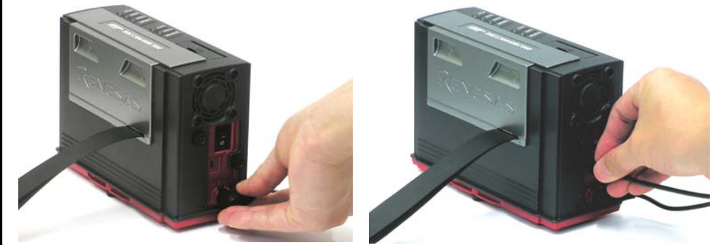
エミュレータ電源